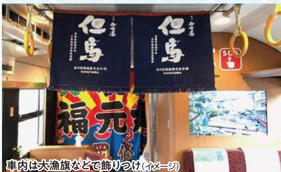
車内は大漁旗などで飾りつけ(イメージ)