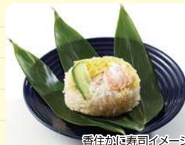
香住かに寿司イメージ