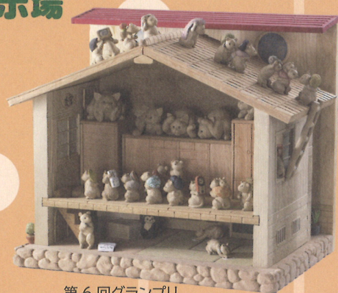
第6回グランプリ 猫屋 猫吉(兵庫県) 住み心地のいい家

令和元年に第26回を迎える 養父市 木彫フォークアートおおやの これまでの入選作品や 参加作家、大屋町で活躍する作家の 「猫」にちなんだ木彫作品を展示します。