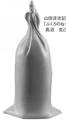
山田洋次記念賞 「ふくろのねずみ」 長沼 克己 作