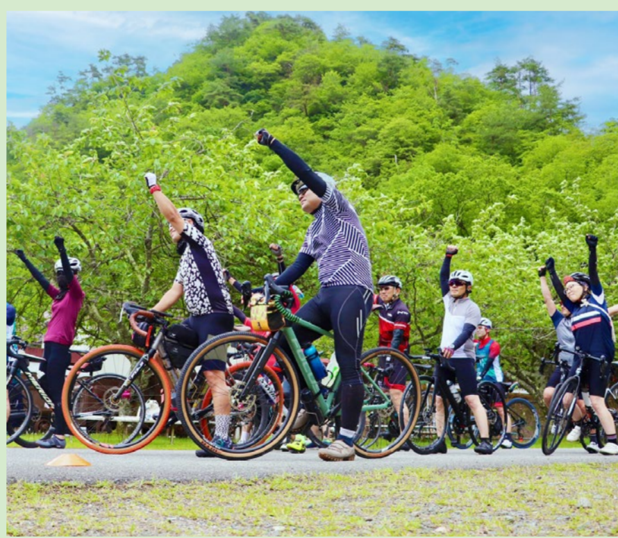
日本遺産「鉱石の道」周遊ロングライドコース