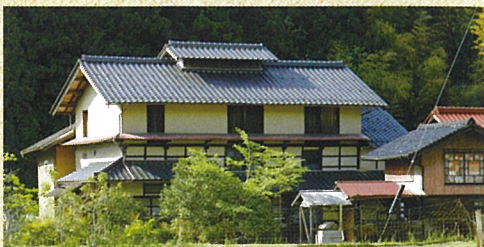
〈メイン会場〉ふるさと交流の家「いろり」