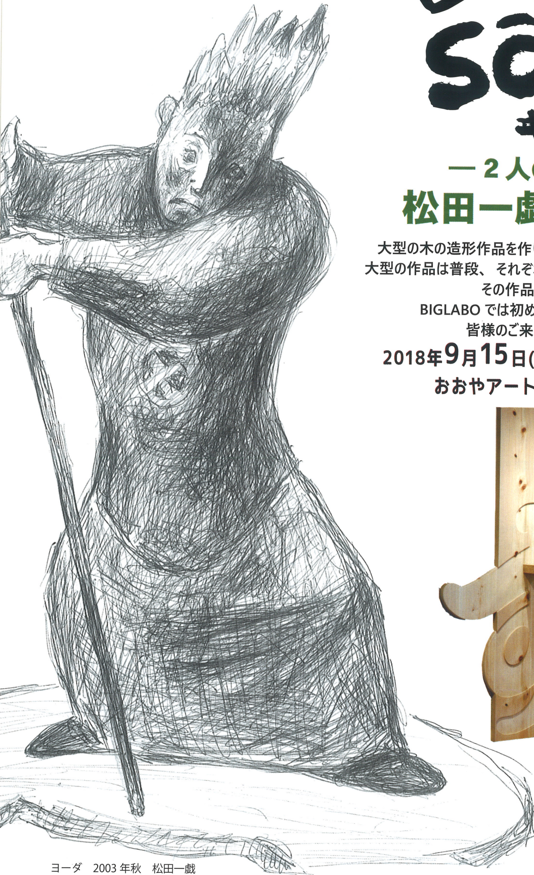
ヨーダ 2003年秋 松田一戯