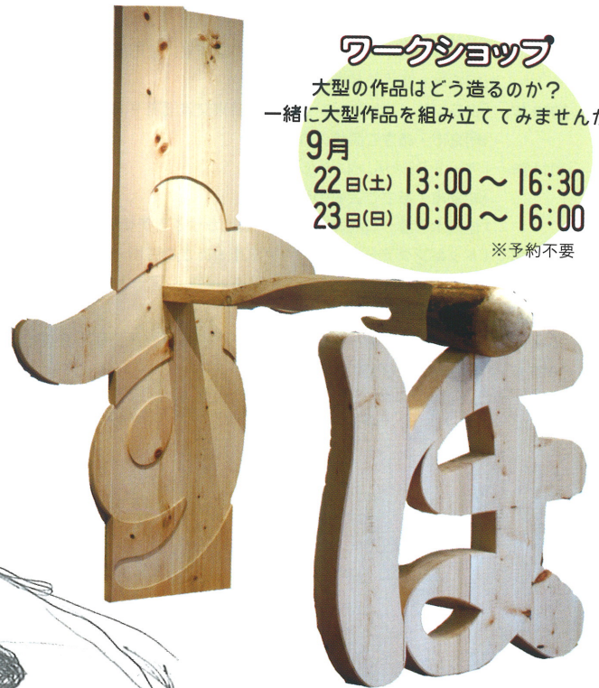
ふれあいの記号 2011-ほっす 池田丈一