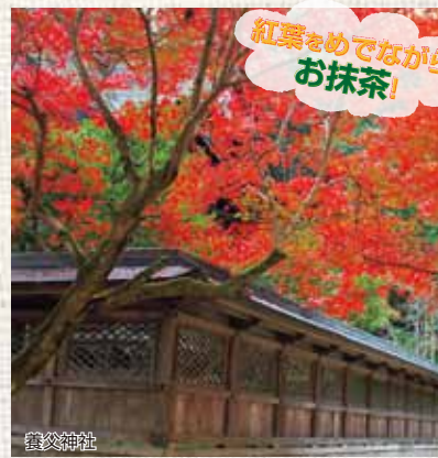
紅葉をめでながらお抹茶!