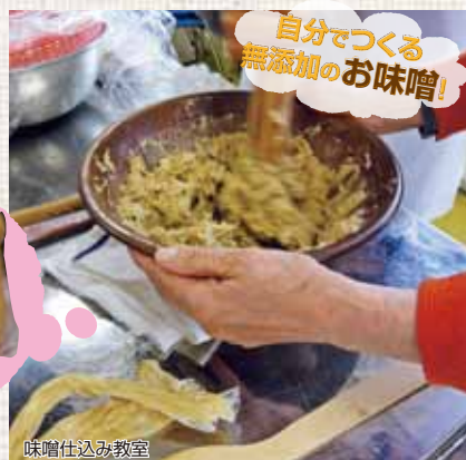
自分でつくる無添加のお味噌!