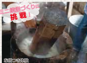
三二餅づくりに挑戦!