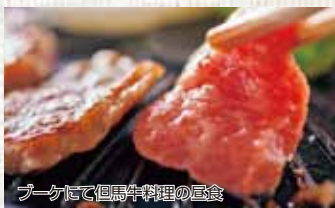
ブーケにて但馬牛料理の昼食