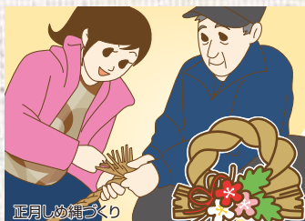
鹿月しめ縄づくり