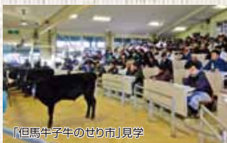
「但馬牛子牛のせり市」見学