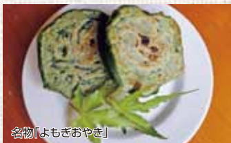
名物「よもぎおやき」